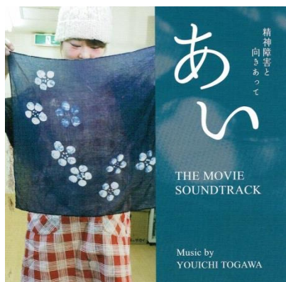
デザインパッケージ表